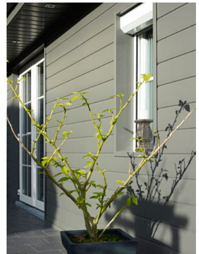
Bardage PVC cellulaire premium P2750

L'isolation d'un logement permet de réduire les rejets de CO 2 dans l'atmosphère et limiter l'effet de serre. De plus, les bardages Deceuninck sont produits selon des méthodes respectueuses de l'environnement. Ils sont durables et 100% recyclables.