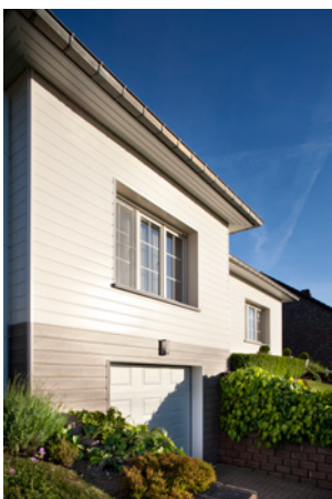
Bardage P2750, coloris blanc et gris cèdre